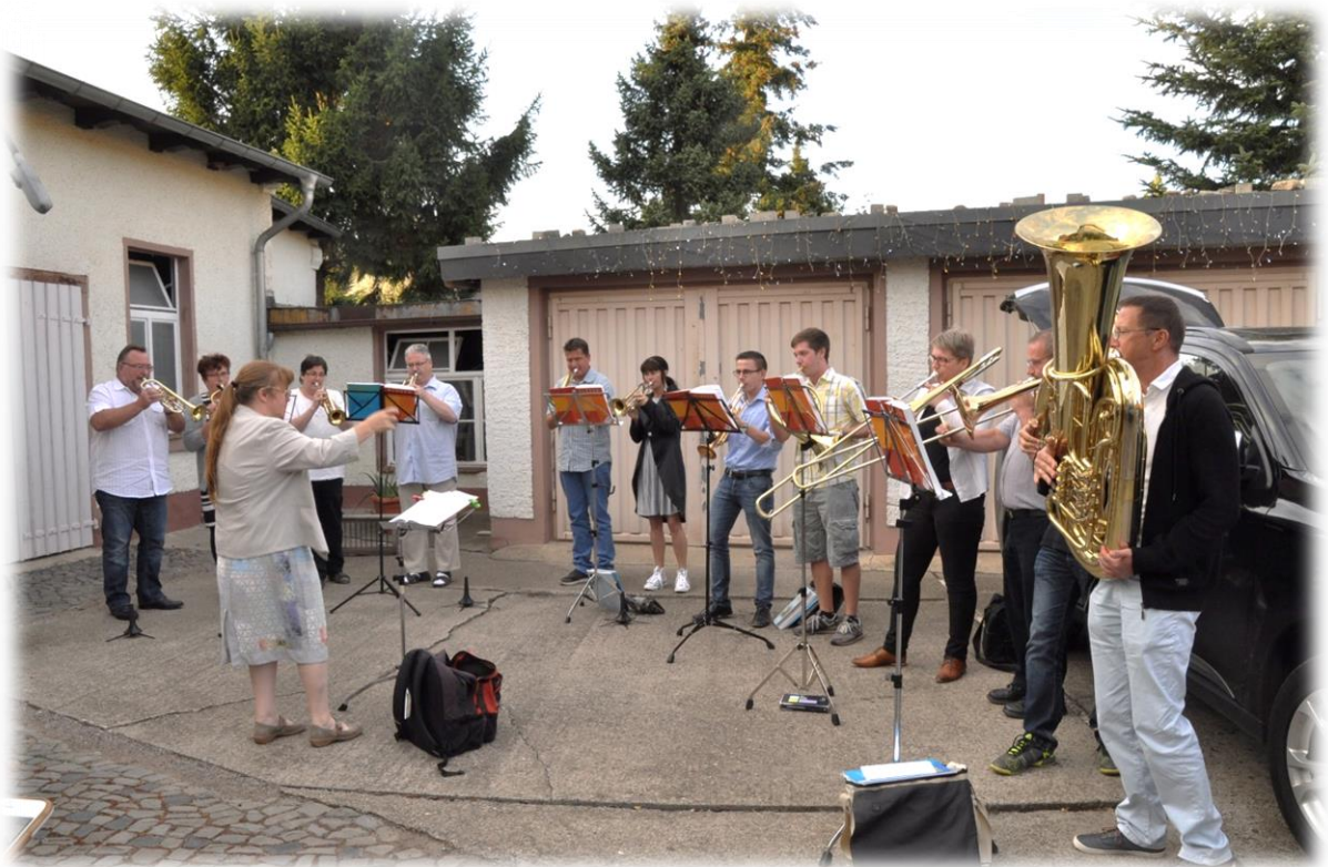
und natürlich Bläser/innen ...