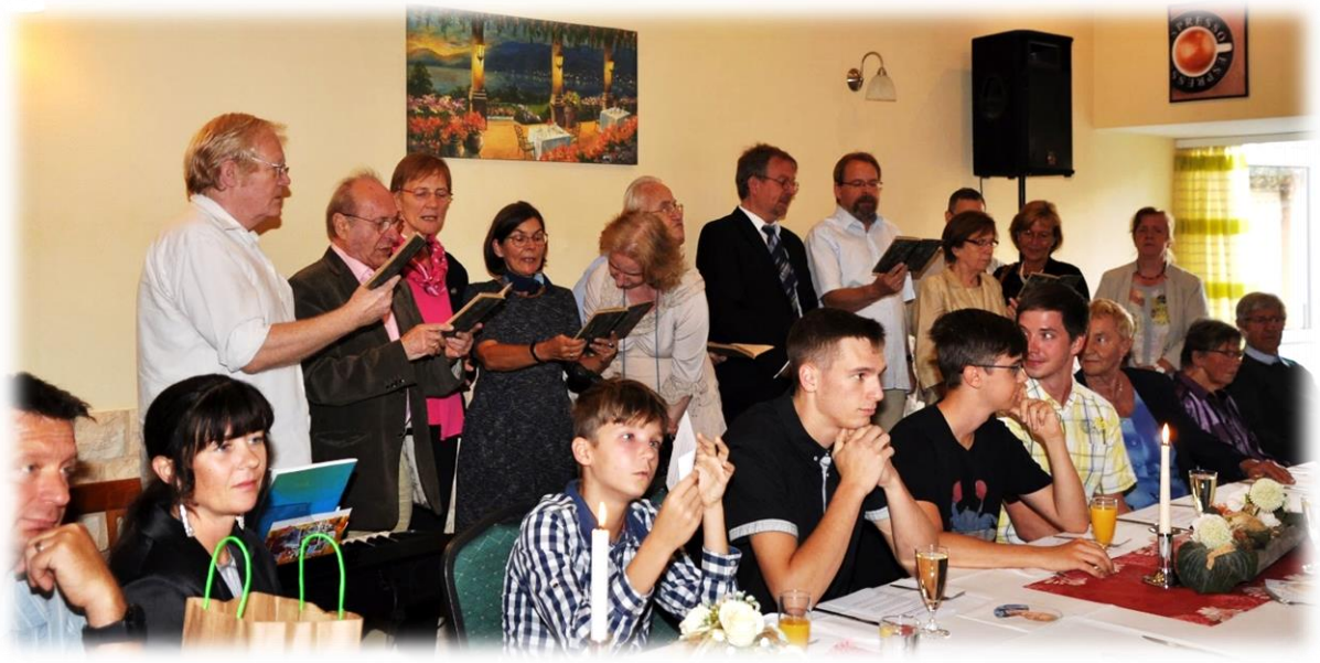
Ad hoc Chor ...